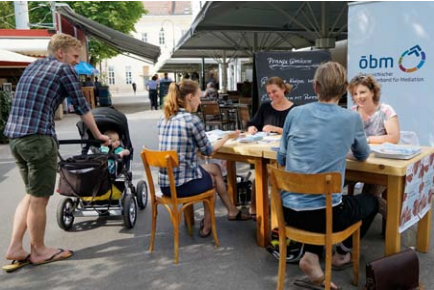
18. Juni: Information über Mediation für Groß und Klein.