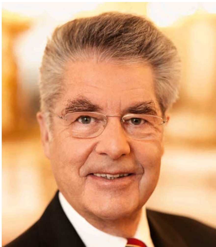
Bundespräsident Dr. Heinz Fischer übersendet beste Wünsche und übernimmt den Ehrenschatz für die Jubiläumsveranstaltung des ÖBM am 17. Juni 2015.